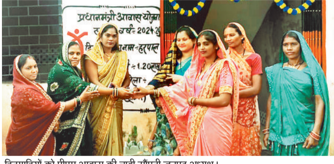
हितग्राहियों को पीएम आवास की चाबी सौंपती जनपद अध्यक्ष।