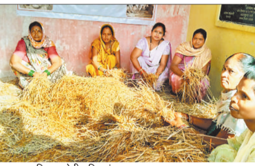
मशरूम प्रशिक्षण लेती महिलाएं।

एसईसीएल कोरबा क्षेत्र अंतर्गत बांकी उपक्षेत्र के द्वारा अपनी माईन क्लोजर प्लान के तहत बांकी बस्ती सामुदायिक भवन में 6 दिवसीय मशरूम उत्पादन