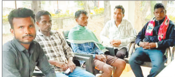
मृत मासूम के परिजन।

और कैसे निगला इसकी जानकारी परिजनो को भी नहीं थी। जब तबीयत बिगड़ी तब वे जिला अस्पताल लेकर पहुंचे। जहां एक्स-रे रिपोर्ट में सिक्के के फंसने की पुष्टि हुई। परिजनो का आरोप है कि जिला अस्पताल के चिकित्सकों ने बच्चे की हालत गंभीर बताई और कहा कि