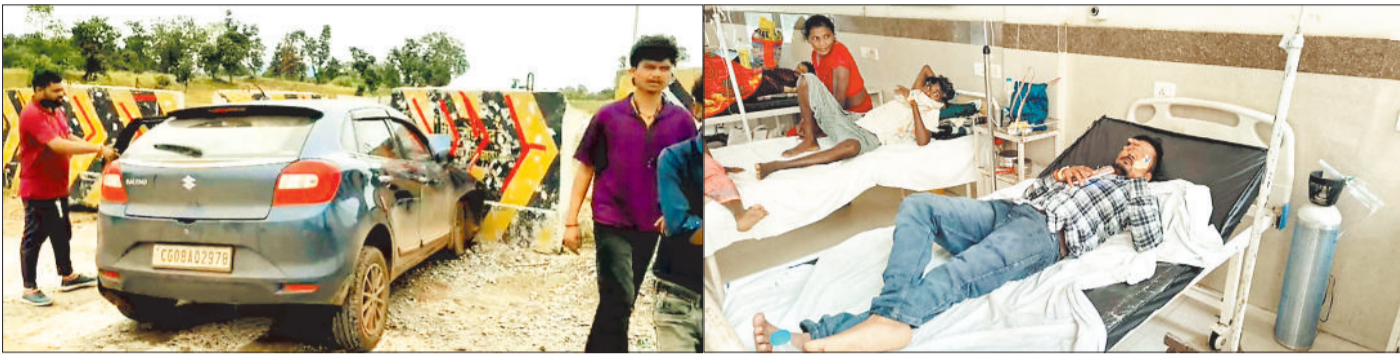
दुर्घटनाकारित कार व घटना स्थल पर एकत्रित भीड़। अस्पताल में दाखिल घायल।

हरिभूमि न्यूज कोरबा सुतरां के पास एनएच 31 पर एक तेज रफ्तार बलेंगे कार डिवाइडर से टकरा गई, जिससे कार में सवार एक युवक की मौके पर ही मौत हो गई। वहीं कार सवार चार लोग गंभीर रूप से घायल हो गए। हादसा इतना जबरदस्त था कि कार के परखच्चे उड़ गए। सड़क हादसे में घायल लोगों को उपचार के लिए अस्पताल में भर्ती कराया गया है। कटघोरा थाना क्षेत्र के ग्राम सुतरां के