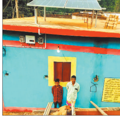
घर पर लगा सोलर पैनल।

योजना, डीएमएफ मद के द्वारा प्रधानमंत्री सूर्य घर विद्युत योजना के अभिसरण मॉडल के रूप में यह कार्य न केवल ऊर्जा उपलब्धता का समाधान है, बल्कि एक सशक्त और सतत विकास की दिशा में ठोस