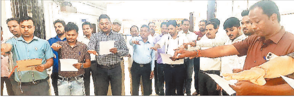
शाय लेते अधिकारी कर्मचारी।