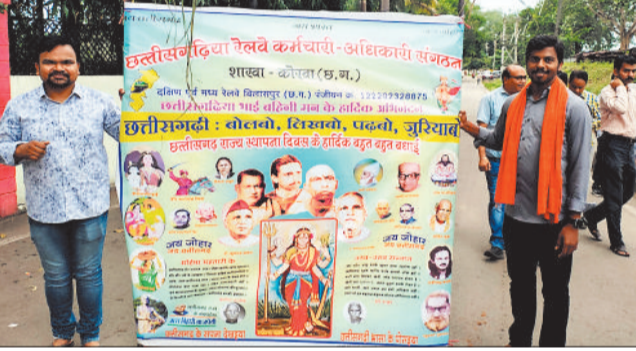
रैली निकालते अधिकारी कर्मचारी संगठन के सदस्य।

को राज्योत्सव के रूप में मनाया जाता है। इसी रेलवे में छत्तीसगढ़िया कर्मचारी-अधिकारी संगठन के द्वारा छत्तीसगढ़ के लोक नृत्य कर्मा जिसमें 50 महिलाओं की टीम द्वारा रैली रेलवे स्टेशन परिसर में निकालकर राज्योत्सव का आनन्द लिया गया। इस अवसर पर रेलवे में कार्यरत देश के विभिन्न राज्यों के कर्मचारी एवं