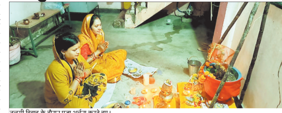
तुलसी विवाह के दौरान पूजा अर्चना करते हुए।